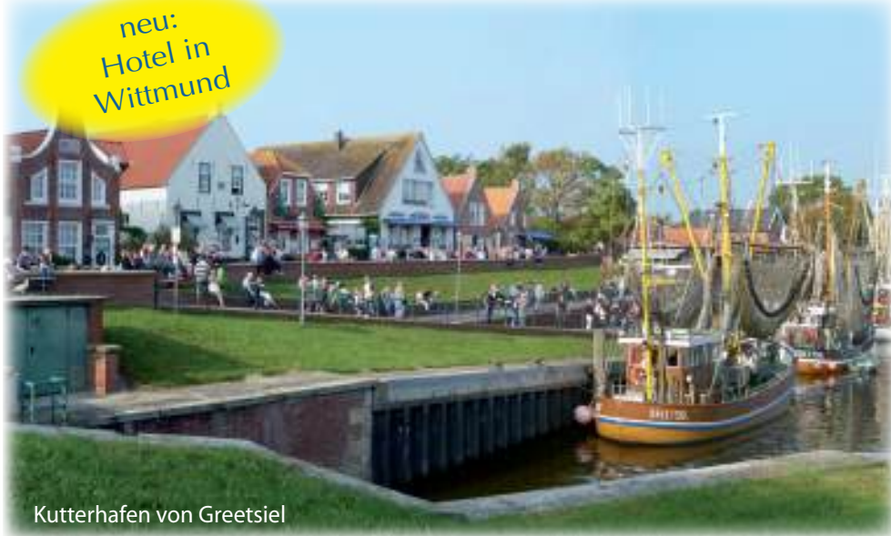
Kutterhafen von Greetsiel