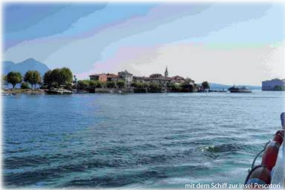
mit dem Schiff zur Insel Pescatori