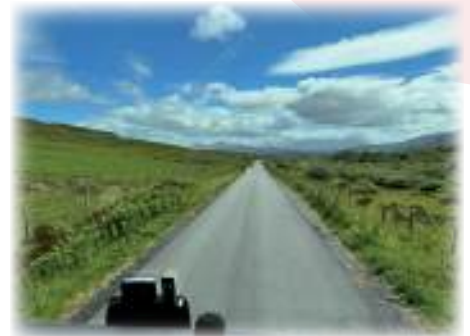
unterwegs in Schottland