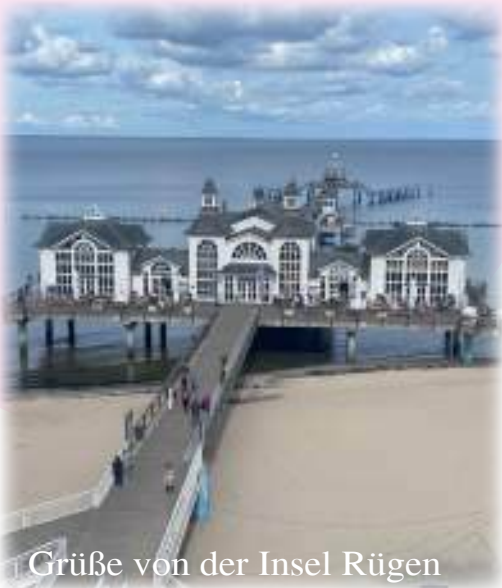
Grüße von der Insel Rügen