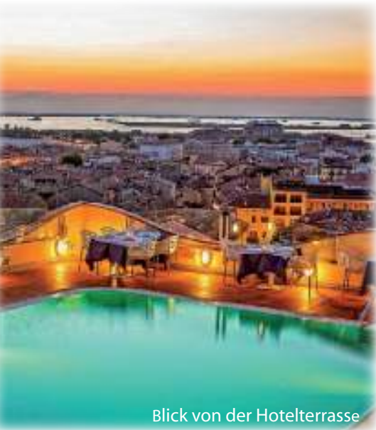
Blick von der Hotelterrasse