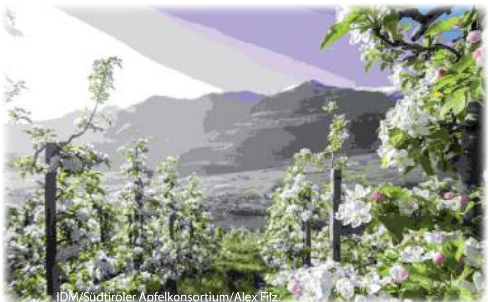
IDM/Südtiroler Apfelkonsortium/Alex Filz