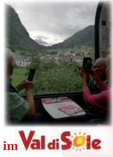
im Val di Sole